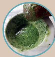
PESTO ALLA CERIALESE