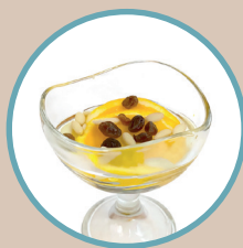
IL DOPO PASTO DI UNA VOLTA