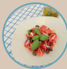
CONDIGLIONE ALLA CERIALESE